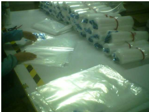
车间生产情况及成品