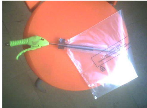
第二步：将气枪塞入气嘴，深度不限