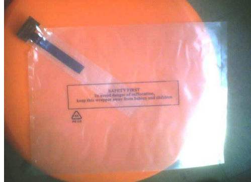
单个产品打开图示