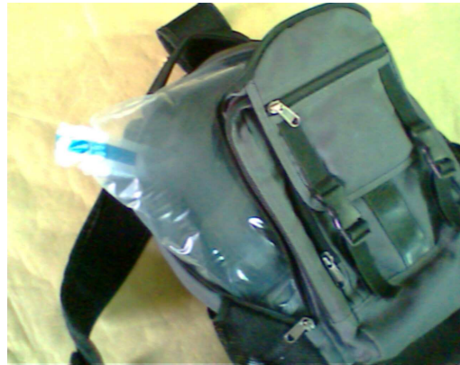
填充箱包产品示意图