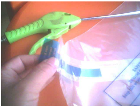
第一步：用拇指搓开气嘴口