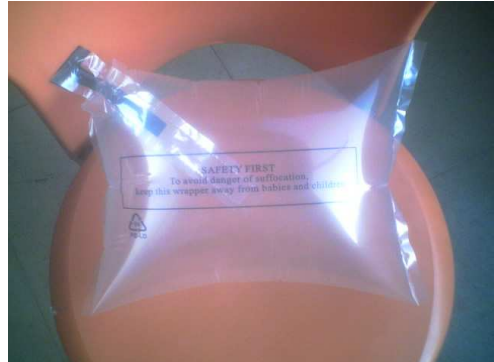
第四步：完成充气，缓缓拔出气枪